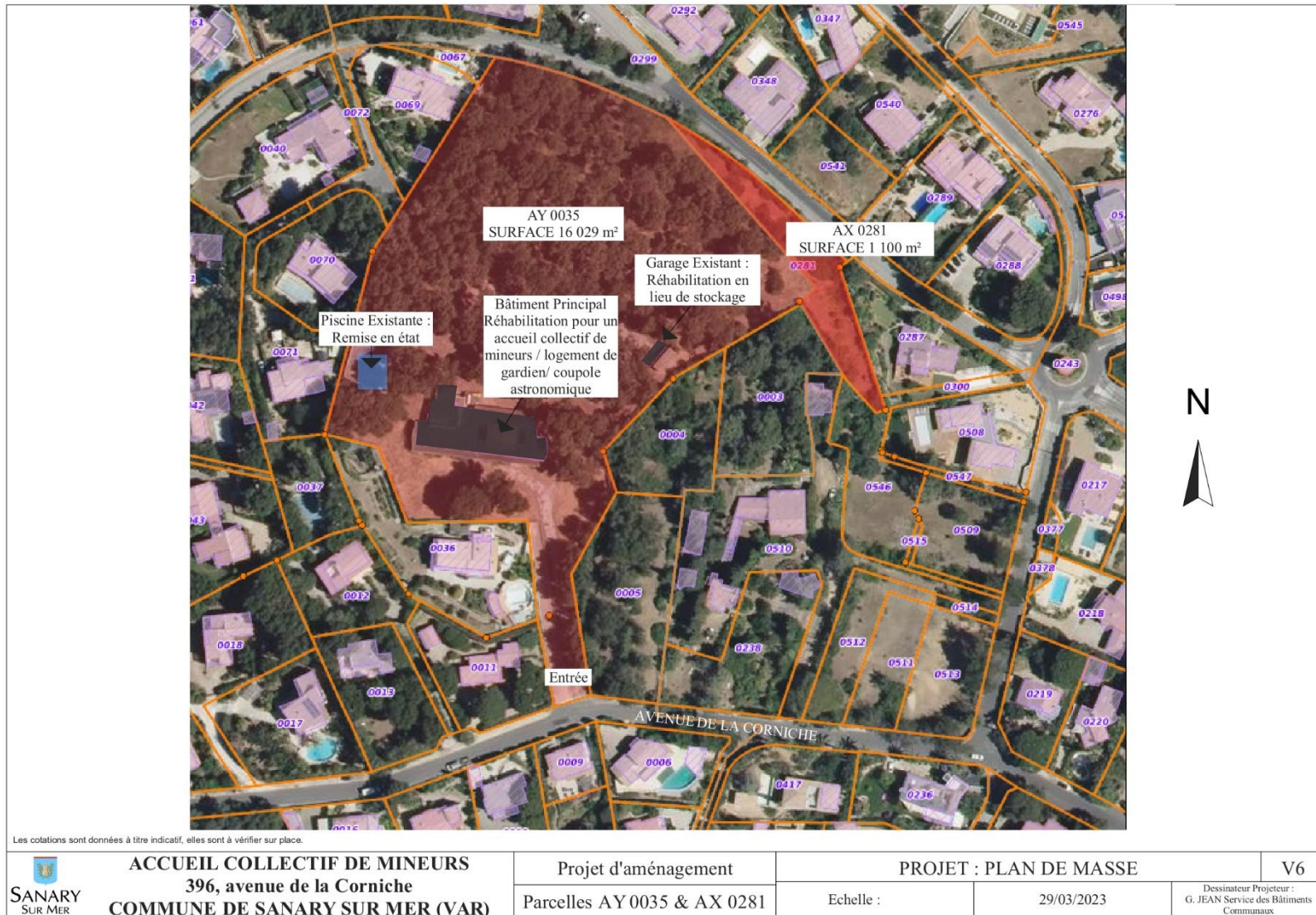
Plan de l'aménagement prévu